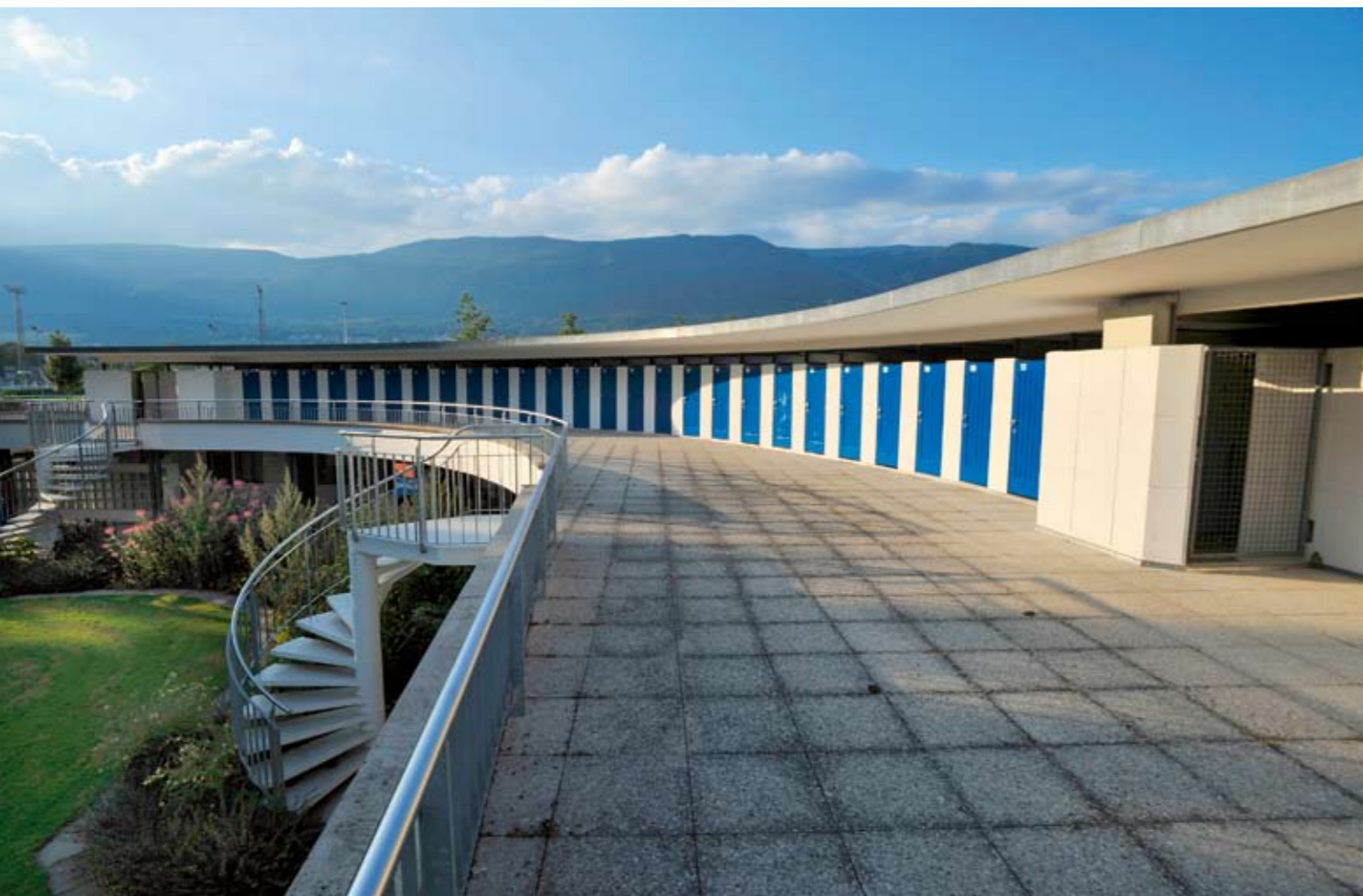
Flair der Fünfzigerjahre: Das Grenchner Freibad besticht durch seine geschwungene Garderobenanlage.