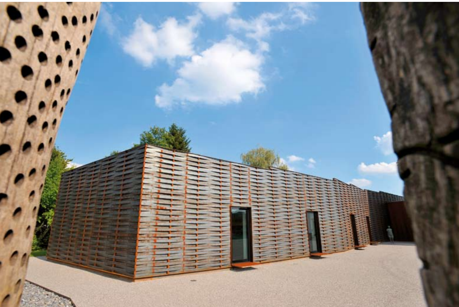
Stahlflechtwerk: Der Erweiterungsbau des Kunsthauses liess das Gebäude zu einer Skulptur werden.

A m besten kommt man mit dem Zug in Grenchen an. Am besten zweimal. Einmal in Grenchen Nord, das andere Mal in Grenchen Süd. Und man wird erkennen: Die Stadt hat zwei Gesichter. Im Norden, mit dem Heimatstilbau des Nordbahnhofs, gibt sie sich recht gemütlich. Im Süden präsentiert sie sich seltsam karg. Obwohl, das stimmt so nicht mehr. Ankommen am Bahnhof Süd ist seit einiger Zeit speziell. Zu tun hats mit dem neuen Kunsthaus. Doch davon später.