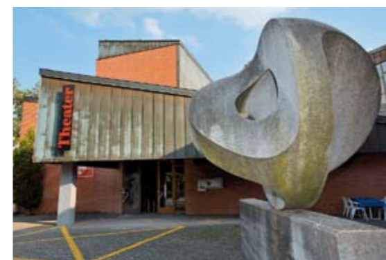
Markant: Das Parktheater, ein ausladender Backsteinbau.

rundherum sein Image, das Image einer heruntergekommenen Stadt, nicht loswurde. In den Städteratings des Wirtschafts magazins «Bilanz» landete sie einmal auf dem letzten, ein anderes Mal auf dem zweitletzten Platz. Grenchen, das hässliche Entlein. Und nun hat die Stadt den Wakkerpreis