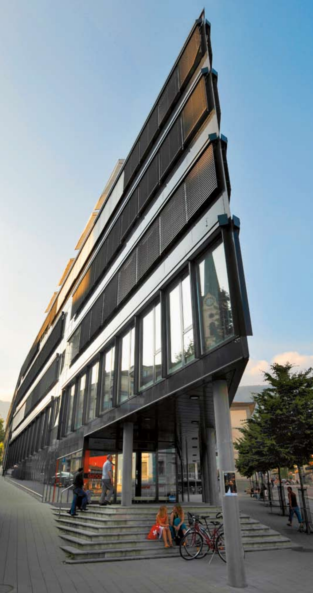
Zugespitzt: Moderne Architektur prägt einen Teil der Innenstadt.