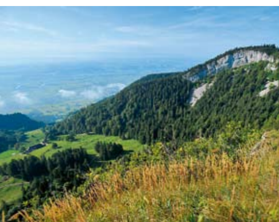
Der Hausberg: Wem am Jurasüdfuss nach Natur zumute ist, der steigt auf den 1400 Meter hohen Grenchenberg.

während meiner Grenchner Zeit ein Schulhaus. Mit einer besonderen Note. Der Sohn des Abwärts, gross und brummig wie ein Grizzlybär, und vom exotischen Wunsch beseelt, Matrose zu werden, lud ab und zu ein paar Kumpels und meine beste Freundin und mich ins Herrschaftshaus zur Hitparadenparty ein.