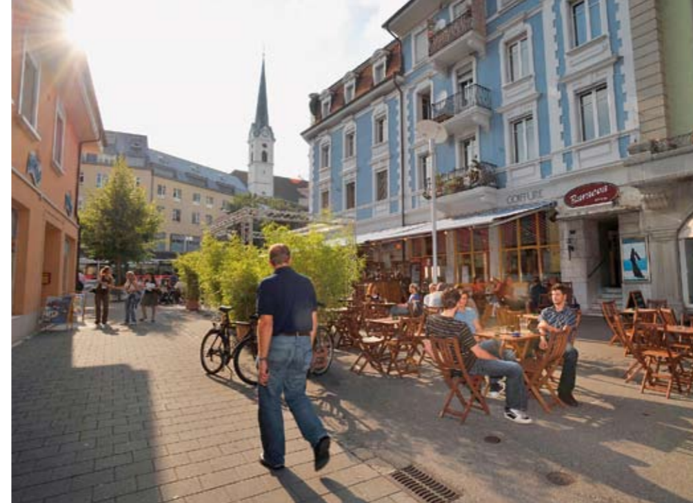
Draussen sein macht Spass, seit das Zentrum fussgängerfreundlich gestaltet worden ist.

Grenchen, für Nichtgrenchner ist das der Ort, den man quert, auf dem Weg nach Biel, auf dem Weg nach Solothurn. Ein Ort, Stadt, und doch Dorf geblieben, in dem ab Mitte der Siebzigerjahre, mit dem Einbruch der Uhrenindustrie, nur noch die Arbeitslosigkeit zu wachsen schien. Ein Ort, der in den Neunzigerjahren, trotz der Ansiedlung von neuen Betrieben, dem umgestalteten autofreien Marktplatz, dem vielen Grün